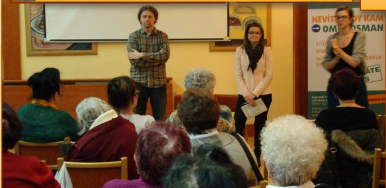
Beseda s právníky kanceláře ombudsmana