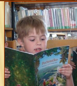
Pasování prvňáčků na čtenáře