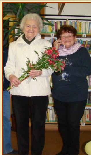
Oblíbené večery poezie