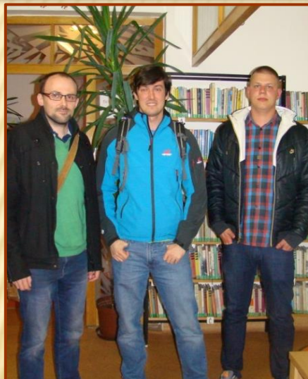
Ždáníčtí cestovatelé sobě