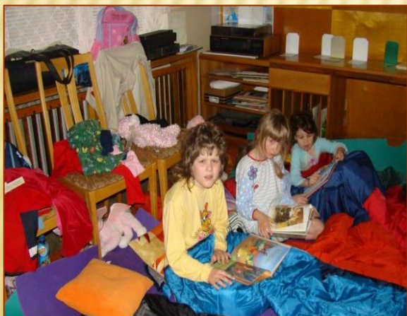
Noc s Andersenem