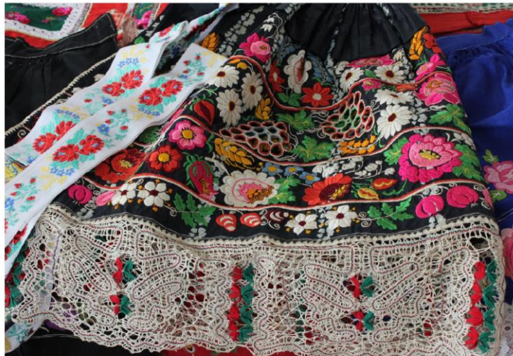
ČAJ O TŘETÍ - KRÁSA LIDOVÉHO KROJE